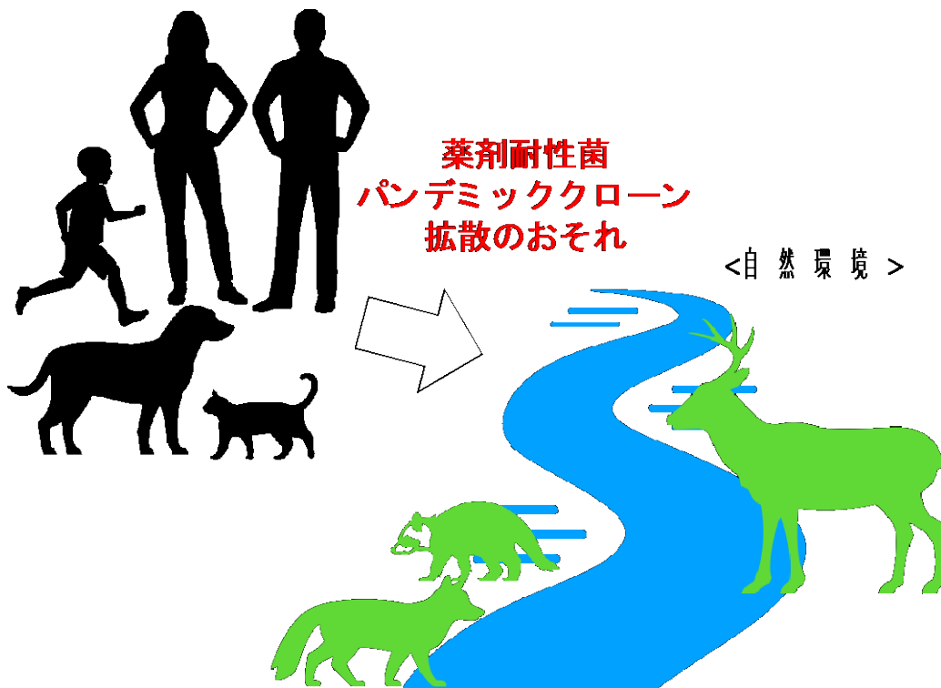
図 1. 薬剤耐性大腸菌 ST131 の人社会から自然環境への拡散