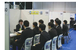
就職支援 (企業説明会) Job fair organized by University