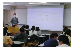
授業の様子 (全学共通教育) In class (General education)

The Center for International Affairs offers Japanese language, culture and society classes for international students. The Center also provides a wide range of support for international students to help make their stay in Tottori safe and fulfilling. For Japanese students, the Center organizes a variety of overseas programs such as in-country short-term language training, overseas language programs, and student-exchange programs. It also provides pre-departure programs to ensure students have a safe and successful exchange experience. The Center also plays a crucial role in promoting globalization and international exchange in the local community.