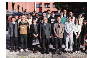
留学生との交流 Exchange with international students