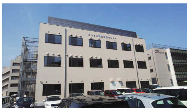
とっとり創薬実証センター