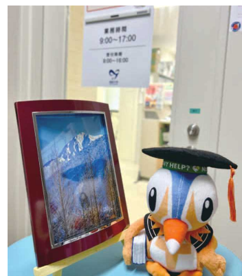
保健管理センター (米子地区)