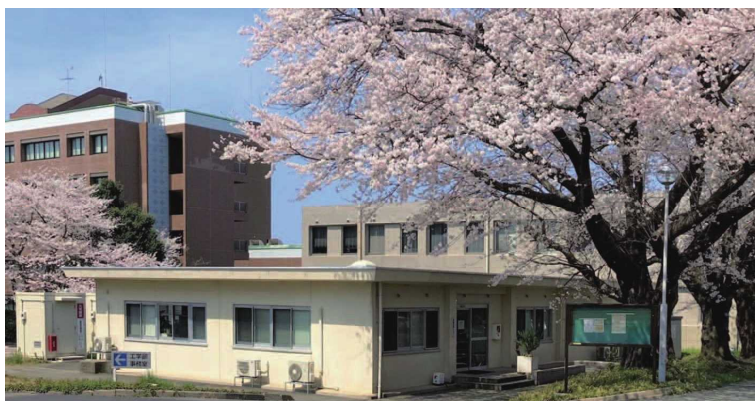
保健管理センター (鳥取地区)

Full-time teachers (2 doctors) and public health nurses and nurses, part-time school doctors (physician, obstetrician and gynecologist, psychiatrist) and counselors (certified public psychologist/clinical psychologist) are available for consultation. We also provide first aid for sickness and injuries on campus.