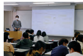
授業の様子 (全学共通教育) In class (General education)

国際交流センター (Center for International Affairs) 国際交流センターでは、外国人留学生への日本語・日本事情教育や生活面のサポートを行っています。また、全学生を対象として、短期語学プログラム、海外実践教育プログラム、交換留学などの派遣プログラムの実施や海外安全教育を行っています。本センターでは、学内のグローバル化を推進するとともに、地域の国際交流の一翼も担っています。 The Center for International Affairs offers Japanese language, culture, and society classes for international students. The Center also provides a wide range of support for international students to help make their stay in Tottori safe and fulfilling. For all students, the Center organizes a variety of overseas programs such as in-country short-term language training, overseas language programs, and student-exchange programs. It also provides pre-departure programs to ensure students have a safe and successful exchange experience. The Center also plays a crucial role in promoting globalization and international exchange in the local community.