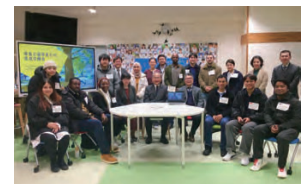
留学生との交流 Exchange with international students