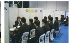
就職支援 (企業説明会) A job fair organized by University