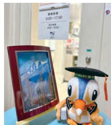
保健管理センター (米子地区)