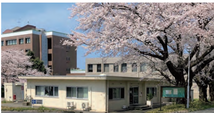
保健管理センター (鳥取地区)

Full-time teachers (2 doctors) and public health nurses and nurses, part-time school doctors (physician, obstetrician and gynecologist, psychiatrist) and counselors (certified public psychologist/clinical psychologist) are available for consultation. We also provide first aid for sickness and injuries on campus.