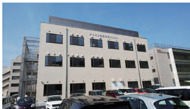
とっとり創薬実証センター