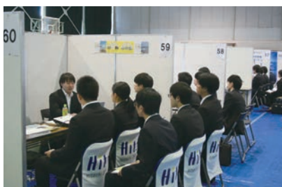
就職支援（企業説明会） A job fair organized by University