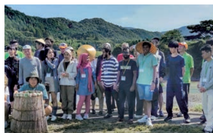
留学生と地域住民との交流 Interaction between local residents and international students