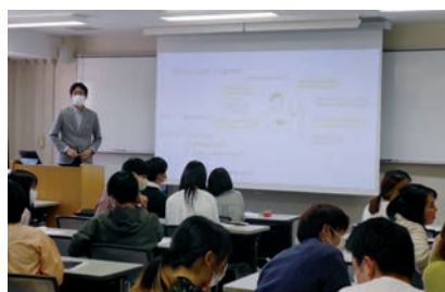
授業の様子（全学共通教育） In class (General education)

The Center for International Affairs offers Japanese language, culture, and society classes for international students. The Center also provides a wide range of support for international students to help make their stay in Tottori safe and fulfilling. For all students, the Center organizes a variety of overseas programs such as short-term language training, overseas practical education programs, and student-exchange programs. It also provides pre-departure programs to ensure students have a safe and successful exchange experience. The Center also plays a crucial role in promoting globalization and international exchange in the local community.