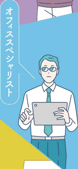
オフィススペシャリスト