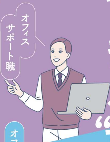
オフィス サポート職