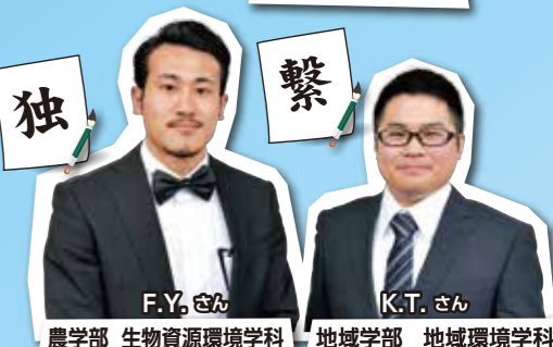
農学部 生物資源環境学科 地域学部 地域環境学科