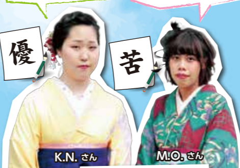
地域学部 地域環境学科