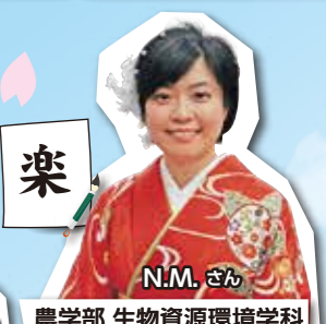
農学部 生物資源環境学科

感想 新入生のみなさん、ご入学おめでとうございます。今回が初めての取材で緊張していましたが、みなさんのフレッシュなお話を聞けてとても楽しい取材になりました。ぜひ充実した大学生活を送ってください！(担当 松本)