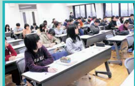
講師の方のお話を聞く学生の様子

インタビュー内容 ①どのような職業に興味がありますか？ ②地域就業論で一番面白かった講義は何ですか？ ③この講義を通してどのようなことを学びましたか？