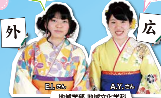
地域学部 地域文化学科