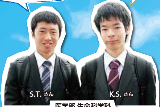
医学部 生命科学科