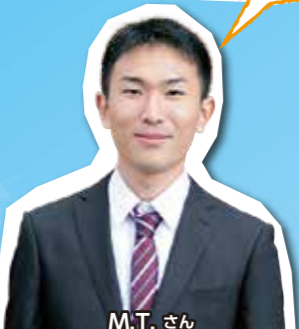
M.T.さん 工学部 電気情報系学科