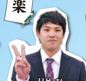
工学部 応用数理工学科