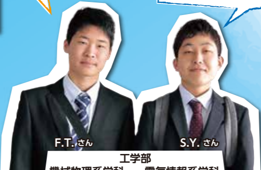
工学部 機械物理系学科 電気情報系学科