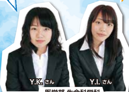
医学部 生命科学科