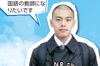
N.R.さん 地域学部 地域学科人間形成コース