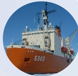
研究船(南極観測船など)