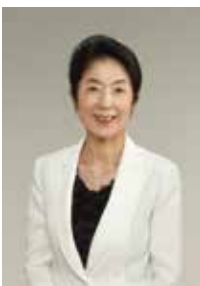
鳥取大学 ダイバーシティキャンパス推進担当

鳥取大学は「人間力」を基本にしています。構成員それぞれが人として成長できる、明るく楽しくかつ規律ある大学を目指して、みんなで一丸となって取り組んでいきたいと思います。