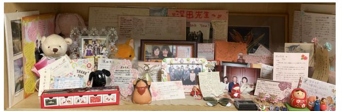
学生のみなさんからいただいたメッセージ

長く鳥取大学で働かせていただいていることへの感謝の気持ち（トリダイ愛）は、今の仕事にも影響を与えています。在外研究員や内地留学で学ぶ機会をいただいたこと、育児や介護をしながらも仕事を続けさせていただいたこと、社会人大学院生として研究に取り組みさせていただいたことなど多くの人たちからいつも暖かく、そ