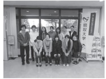
鳥取大学ののぼりと（広報センターにて）

日本の店舗には、看板やポスターの他にも宣伝には欠かせないアイテムがあります。それは、幟（のぼり）・旗・横断幕・垂れ幕・タペストリーといった「たなびく広告たち」です。私たちの班は、湖山街道と鳥取南バイパス、そして若桜・智頭街道にある全ての「たなびく広告たち」を調査し、色や大きさなど計14項目について分析し、特徴や傾向を調べました。発表では、分析の結果に加え、項目間の関係、背景や要因についての考察も報告します。