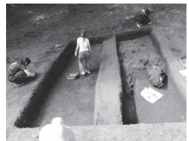
大熊段古墳発掘調査風景

鳥取大学湖山キャンパスのある濃山台地には、古来より人々に利用されてきた歴史があり、いくつかの遺跡が残されています。そこから出土した遺構や遺物をもとに、湖山地域がどのような歴史をたどってきたかを検討しました。特に、築造時期が不明な大熊段古墳については、その解明のために発掘調査を行いました。また、大熊段古墳には戦時中に掘られたと伝承される溝などがあるため、その性格も追究しました。それらの調査の結果を報告します。