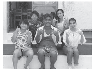
移住者とのインタビューを終えて

「まちづくり」グループは文献調査や鳥取へ移住してきた人々（風の人）へのインタビュー調査を行いました。「夢を追いかけて」という移住者もおられれば、思いがけず鳥取へきて仕事も予期していなかったものに携わっている人もおられます。そんな風の人が鳥取で暮らす工夫や楽しみ方と、地域との関わり方を考察した結果を発表します。