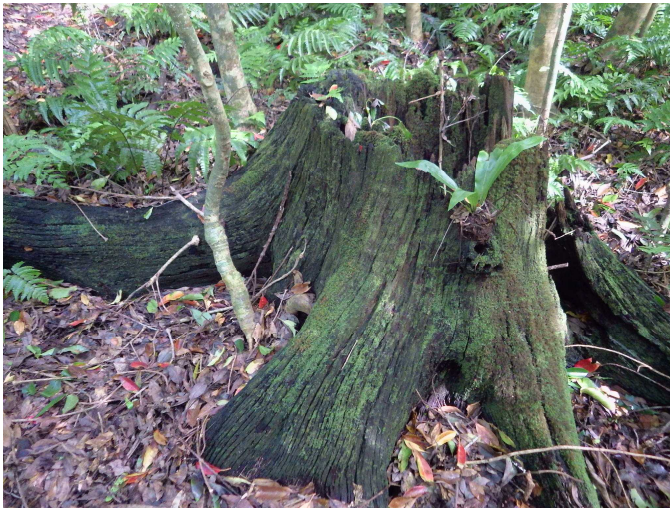
図3. オガサワラグワの古い切株