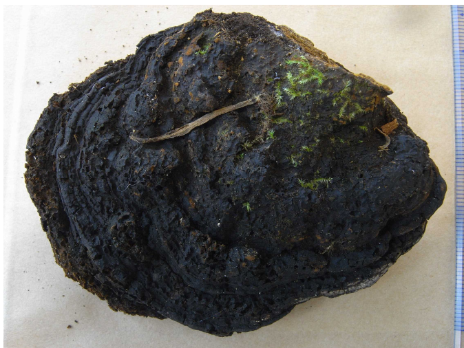
写真 1. 小笠原産オオメシマコブ 上面は通常黒っぽく、ゴツゴツしている。

これらの分布状況を国際自然保護連合 (IUCN) が定める国際的なレッドリストの基準と照らし合わせると、2種ともに最も絶滅の危険性の高い「深刻な危機（絶滅危惧 IA 類）」に該当することがわかりました。